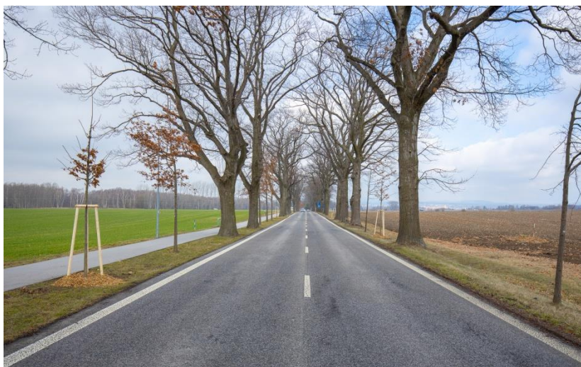
Revitalizace aleje Žitavská