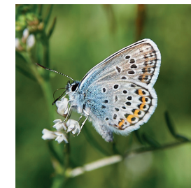
Modrásek / Modraszek

Kvetoucí louky jsou přirozenou součástí naší krajiny již od nepaměti. Chcete společně s námi vytvořit kvetoucí ostrov? Vrátime tím do krajiny nejen její původní rozmanitost, ale pomůžeme tak i zmírnit pokles diverzity rostlin a živočichů.